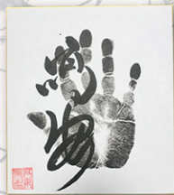
●力士直筆サイン例